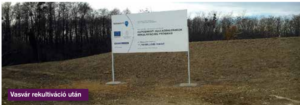
Vasvár rekultiváció után