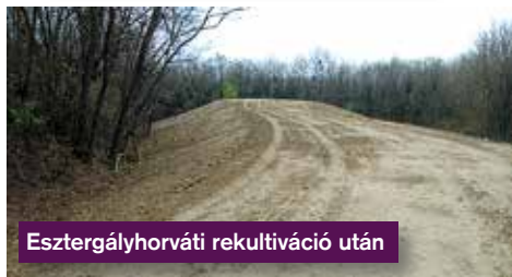
Esztergályhorvát rekultiváció után