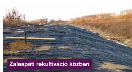
Zalaapáti rekultiváció közben