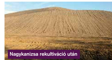
Nagykanizsa rekultiváció után