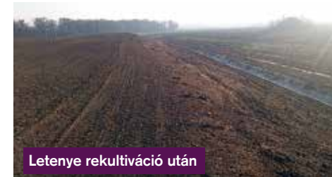
Letenye rekultiváció után