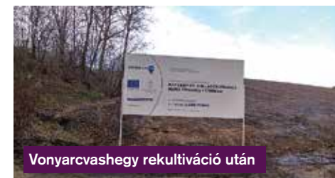
Vonyarcvashegy rekultiváció után