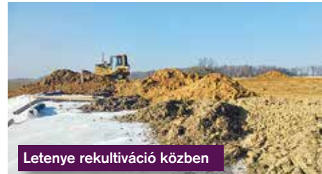
Letenye rekultiváció közben