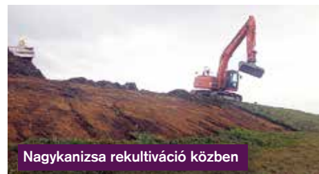
Nagykanizsa rekultiváció közben