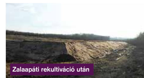
Zalaapáti rekultiváció után