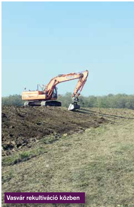
Vasvár rekultiváció közben